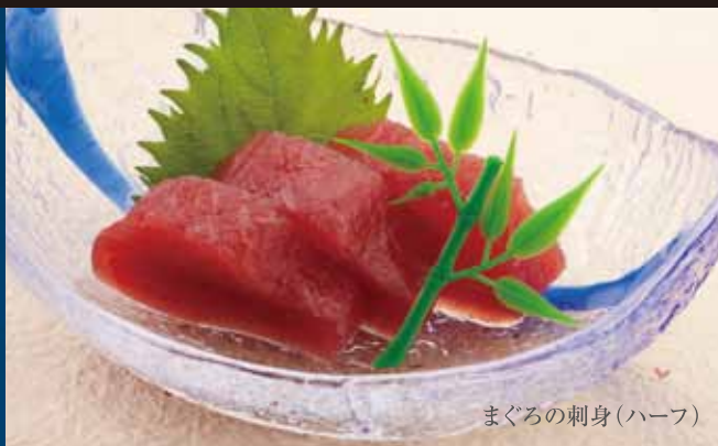
まぐろの刺身(ハーフ)