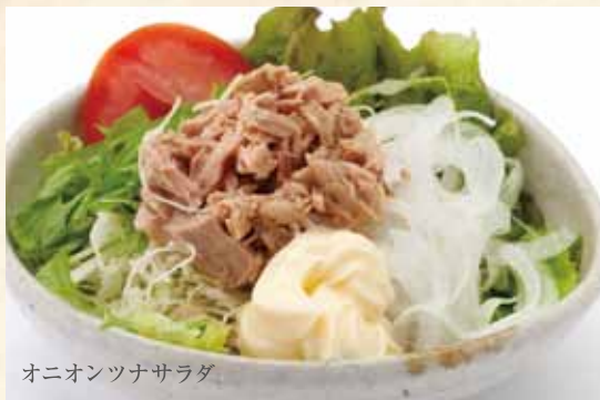
オニオンツナサラダ