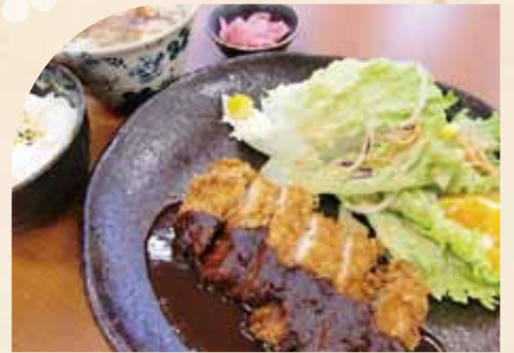
味噌かつ定食 (ご飯・小うどん付)