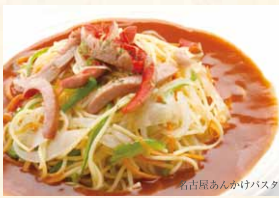
名古屋あんかけパスタ