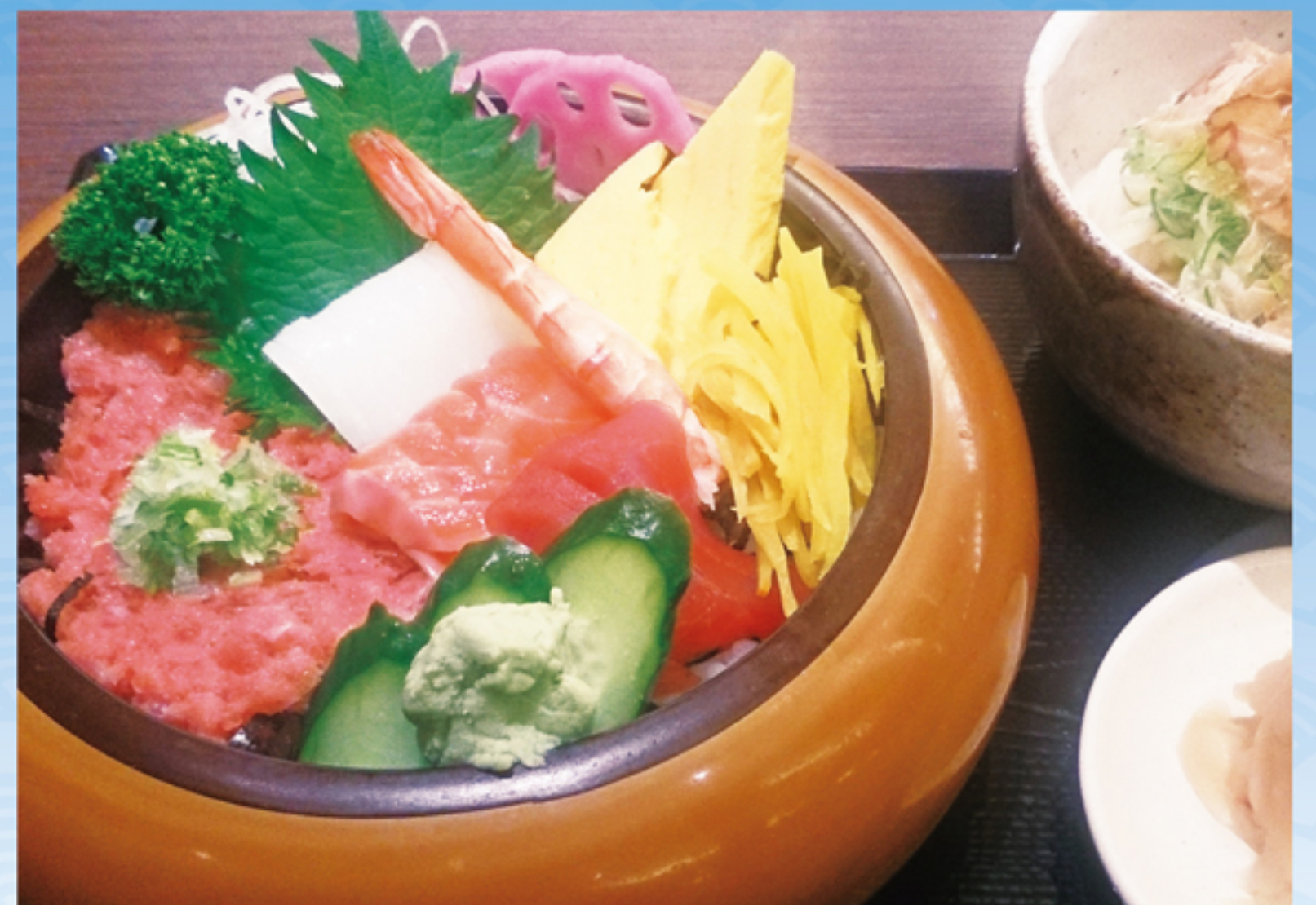
あおい井ランチ (小うどん付)