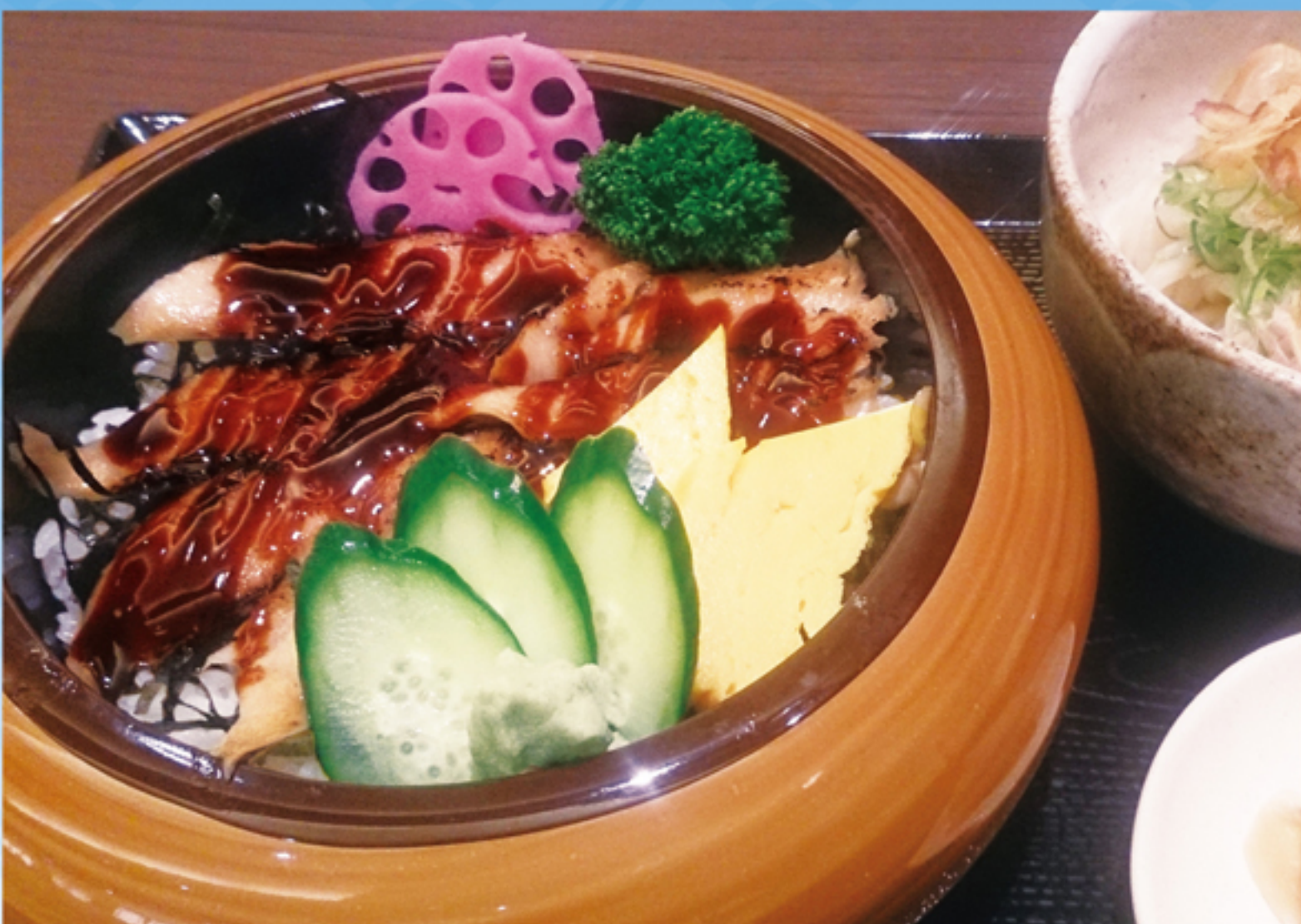
穴子井ランチ (小うどん付)