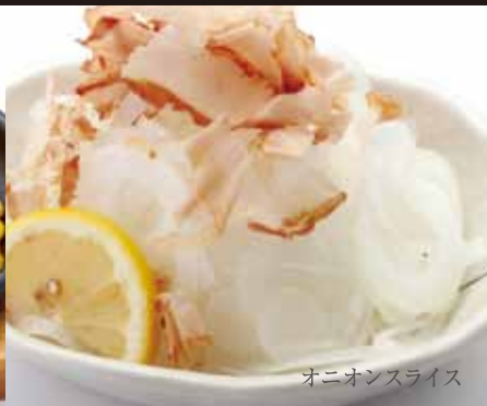
オニオンスライス