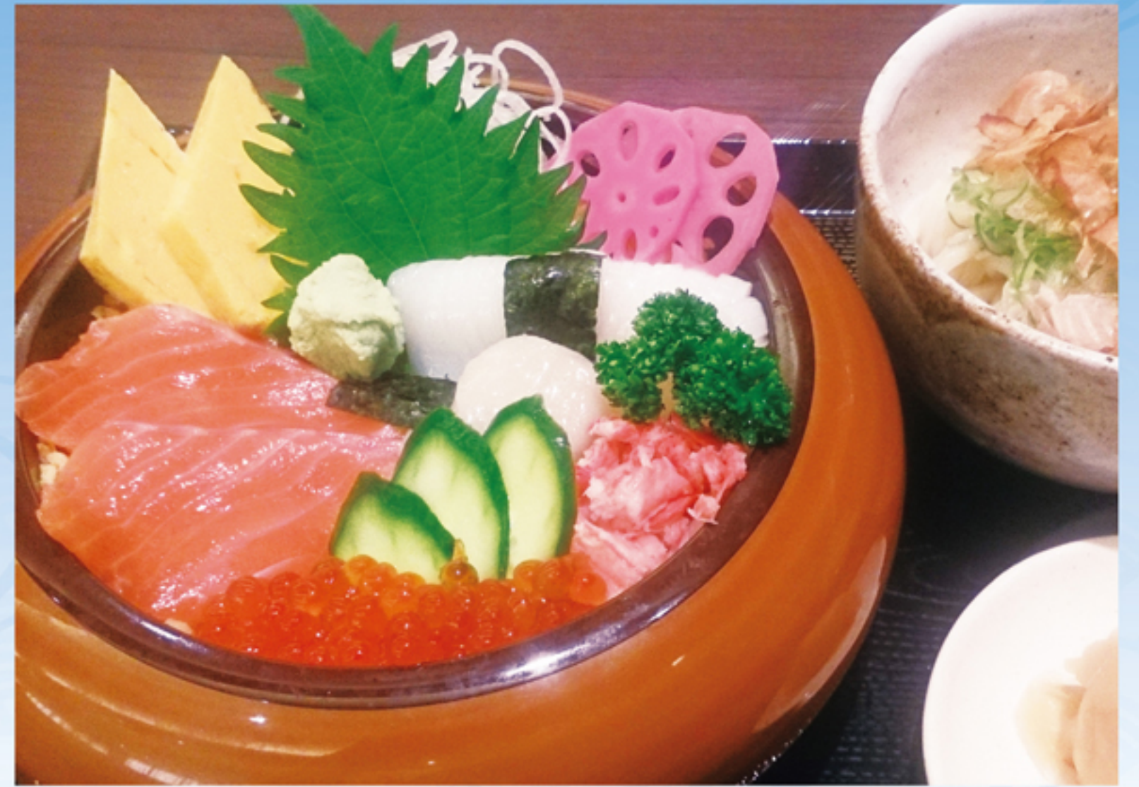
北海井ランチ (小うどん付)