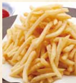
山盛ポテトフライ