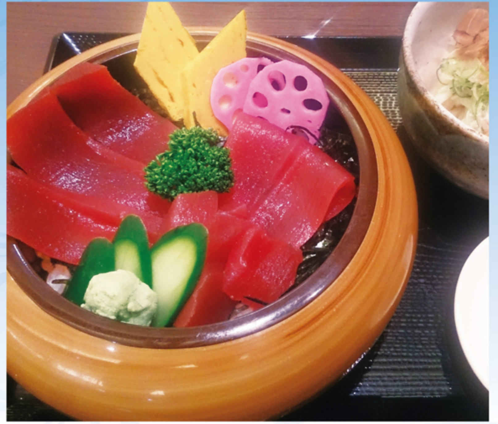
マグロ井ランチ (小うどん付)