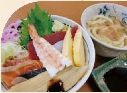
ちらし寿司 (小うどん付)