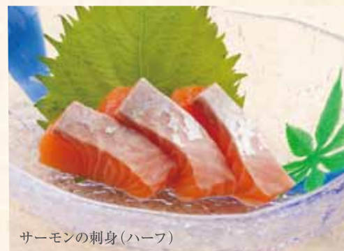
サーモンの刺身(ハーフ)