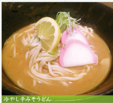
冷やし辛みそうどん