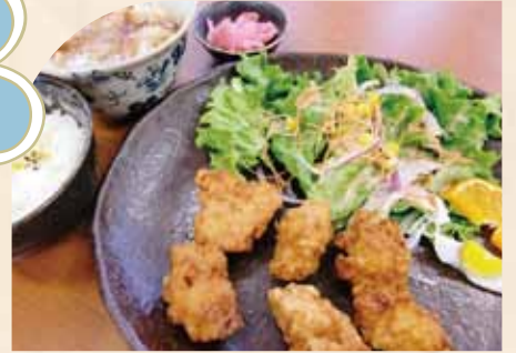
唐揚げ定食 (ご飯・小うどん付)