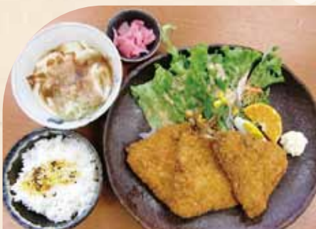
アジフライ定食 (ご飯・小うどん付)