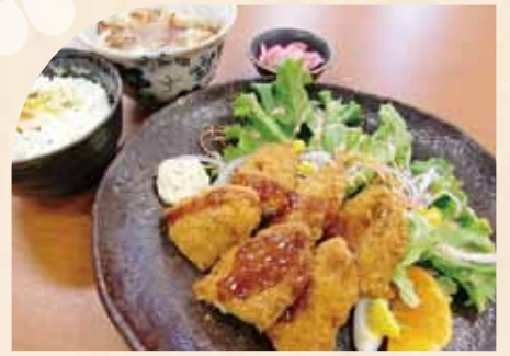
白身魚定食 (ご飯・小うどん付)