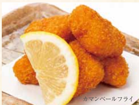
カマンベールフライ