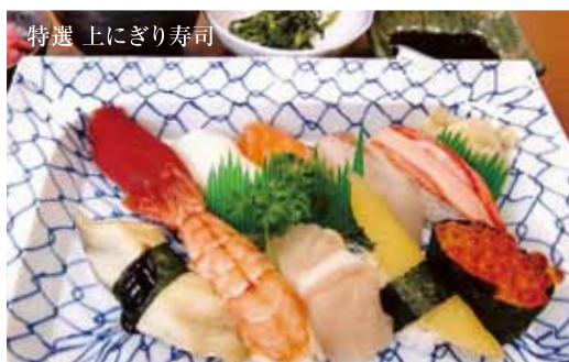
特選 上にぎり寿司