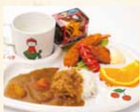
お子様セット(カレー)