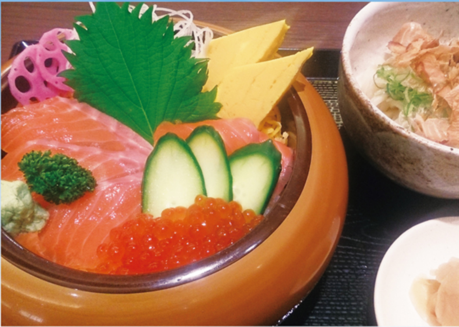
サーモン親子丼 (小うどん付)