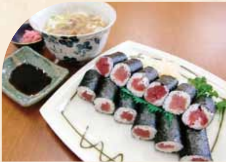
鉄火巻 (小うどん付)