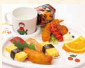
お子様セット(寿司)