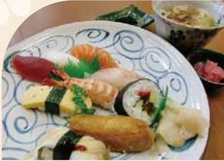
にぎり寿司盛合せ (小うどん付)