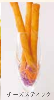
チーズスティック