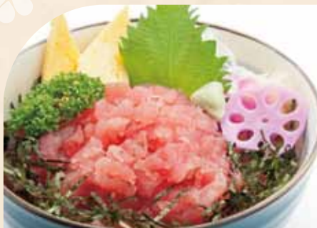
まぐろ中落ち丼 (小うどん付)