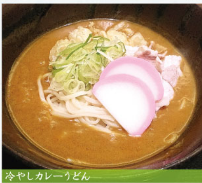
冷やしカレーうどん